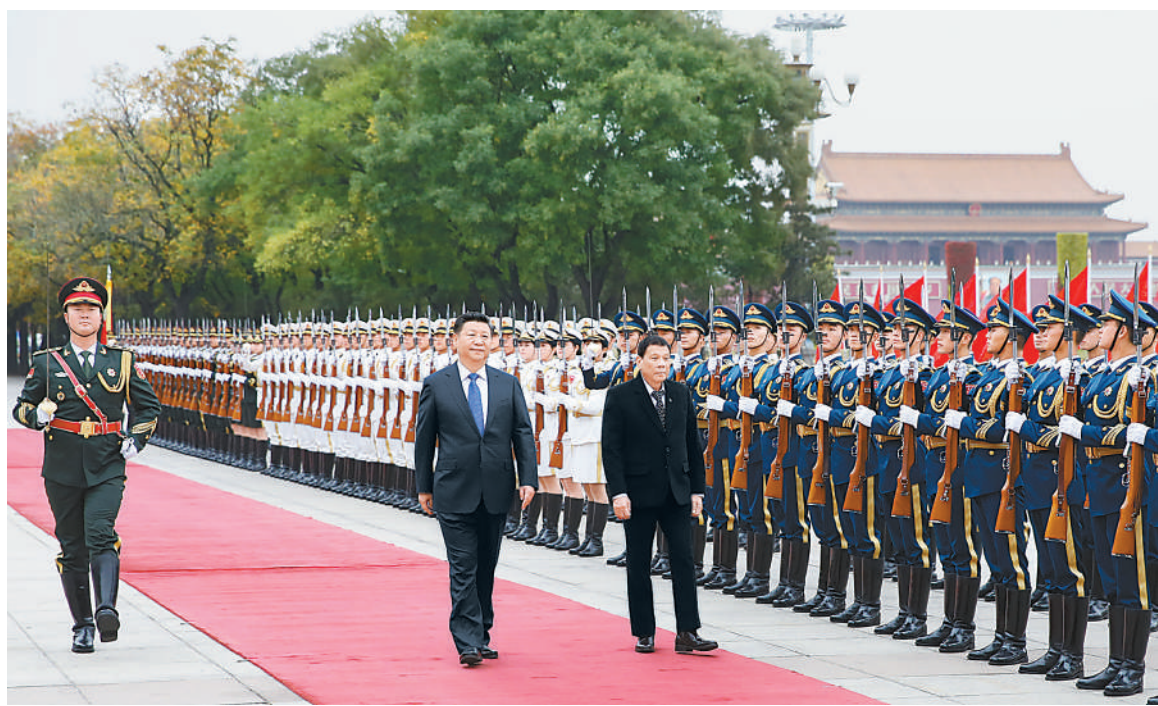
十月二十日，国家主席习近平在北京人民大会堂同菲律宾总统杜特尔特举行会谈。这是会谈前，习近平在人民大会堂东门外广场为杜特尔特举行欢迎仪式。

本报北京10月20日电（记者李伟红）国家主席习近平20日在人民大会堂同菲律宾总统杜特尔特举行会谈。双方一致同意，从两国根本和共同利益出发，顺应民众期盼，推动中菲关系实现全面改善并取得更大发展，造福两国人民。